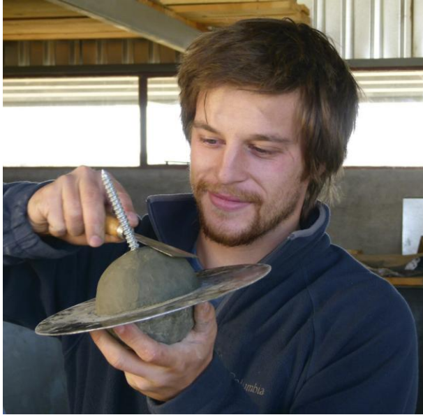
Abb. 4 – Jupiter und Saturn werden aus Beton und Zement „getöpft“

Auch beim Bemalen der Planetenkugeln war Einfallsreichtum gefragt. Welche Details kann man bei diesem kleinen Maßstab noch darstellen? Sollen die Planeten so aussehen, wie sie im Amateurteleskop oder aber von den Planetensonden gesehen werden? Immerhin reichen die Einzelheiten, die wir versucht haben abzubilden, vom Wolkenband der inneren Tropen auf der Erde über den Großen Roten Fleck auf Jupiter bis hin zur Cassini'schen Teilung bei den Saturnringen.