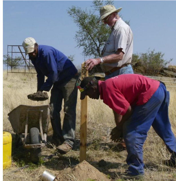
Abb. 5 – Die Holzpfosten mit den Planetenmodellen werden einbetoniert